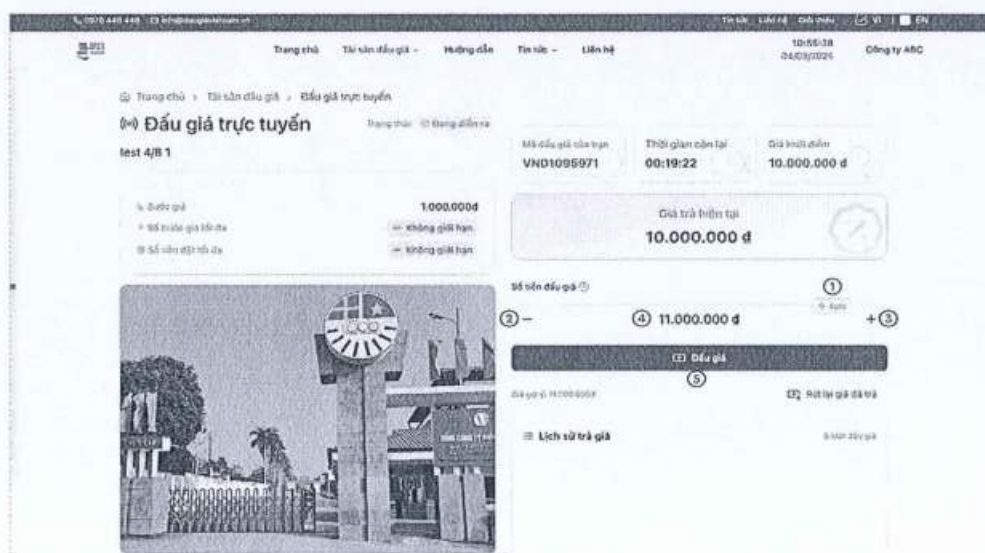
(Hình ảnh minh họa giao diện trả giá trong thời gian đấu giá)

b) Trả giá: Người tham gia đấu giá có thể trả giá liên tục và trả giá nhiều lần trong thời gian đấu giá, không hạn chế số lần trả giá của người tham gia đấu giá. Phiên đấu giá kết thúc khi hết thời gian đấu giá.